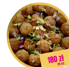
DESKA BURGER lub DESKA HOT-DOG (z opcją wege)