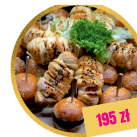
DESKA BURGER X HOT-DOG