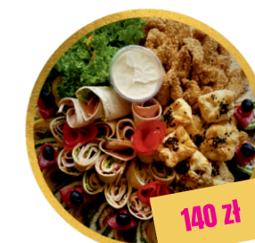
DESKA PRZEKĄSKOWA (z opcją wege)