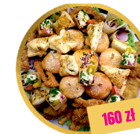
DESKA SOLE MIO (własna kompozycja)